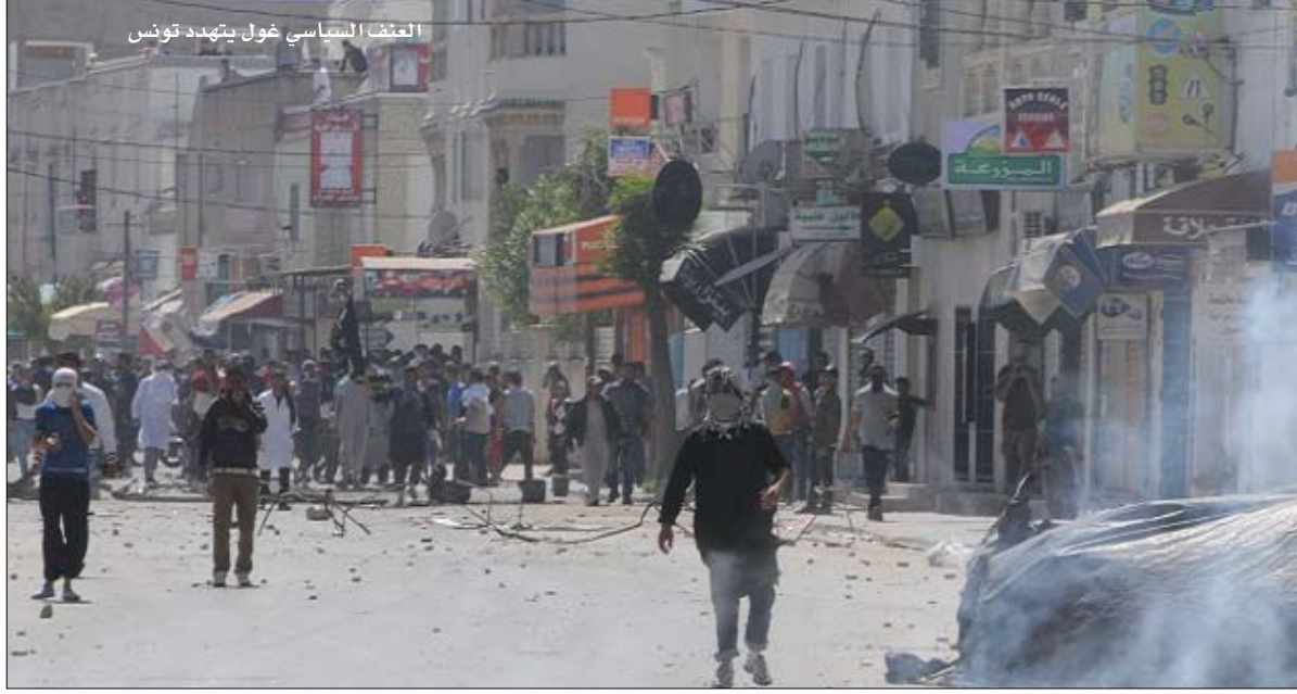
العنف السياسي غول بتهيد تونس