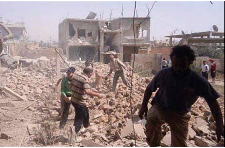
الدمار الشامل لمنازل المدنيين جراء استهداف قوات النظم مدينة القصير بالصف العشوائي

العري تقدم والنظام يرتكب مذبحه جماعية في القصير ومقتل العشرات من حزب الله •• عواصم-وكالات: أعلنت القيادة المشتركة للجيش الحر في بيان لها امس عن تحقيق نجاح كبير في معارك مدينة القصير بريف حمص، واتهمت قوات من حزب الله اللبناني بإعدام 23 طفلا وامرأة في مجزرة جماعية قرب بلدة ريلة. من جهتهم أكد ناشطون مصلح نحو ثلاثين من مقاتلي حزب الله وعشرين من أفراد القوات النظامية وقبوات الشبيحة الموالية في الاشتباكات. وأكدت القيادة المشتركة للجيش الحر في بيانها عن مقتل وجرح عشرات من عناصر حزب الله بمعارك القصير التي أطلقت عليها اسم جدران الموت، وقالت إن هؤلاء نقلوا إلى مستشفيات في بعلبك والهرمل ومشفى الرسول الأعظم بالضاحية الجنوبية لبيروت. وأعلن الحر أنه مستمر بعملياته ضد قوات النظام المدعومة من عناصر من حزب الله بالقصير. كما نفى وصول قوات النظام وسط المدينة مؤكدا أن الاشتباكات تدور على أطرافها. ويتزامن ذلك مع استمرار القصف الجوي والمدفعي العنيف على المدينة القريبة من الحدود اللبنانية. وقال نشطاء المعارضة إن قواتهم