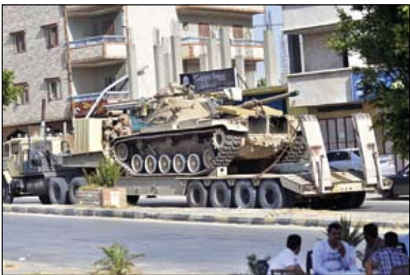
قوات مصرية مدرعة في طريقها إلى سيناء (ا ف ب)

الجيش المصري يعزز قواته في سيناء إثر هجوم على قوات الأمن •• القاهرة-وكالات: قالت مصادر اعلامية في القاهرة أن الجيش المصري أرسل دبابات إلى شبه جزيرة سيناء التي شهدت فجر امس هجوما مسلحا على معسكر قوات الأمن المركزي. في حين تواصل أزمة الجنود المخطوفين هناك. وأوردت الأهرام أن الجيش أرسل دبابات عبر قناة السويس في طريقها إلى شمال سيناء حيث حطفت مسلحون سبعة من أفراد الجيش والشرطة الأسبوع الماضي. ويأتي إرسال هذا بعد أن أكدت مصادر أمنية أن مسلحين هاجموا معسكرا لقوات الأمن المركزي في سيناء فجر امس وتبادلوا إطلاق النار مع القوات الموجودة داخل المعسكر قبل أن ينسحبوا. وأوضحت المصادر أن المعسكر الذي تعرض للهجوم يقع بمنطقة العريش بشمال سيناء، مضيفة أن المسلحين أطلقوا نيران أسلحة آلية من شاحنة كانوا يستقلونها، لكن الهجوم لم يسفر عن سقوط ضحايا. ولم تعرف بعد هوية المهاجمين. وجاء الهجوم في وقت تستمر فيه